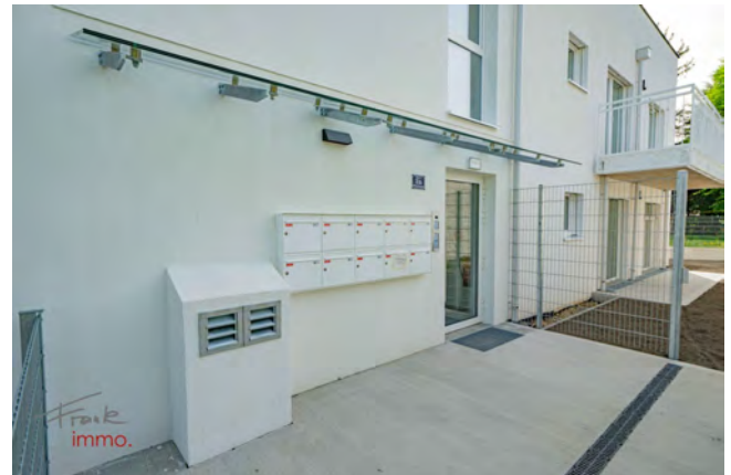
Zugang Stiege 3