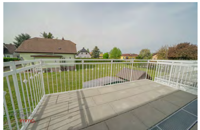
Ausblick Balkon West